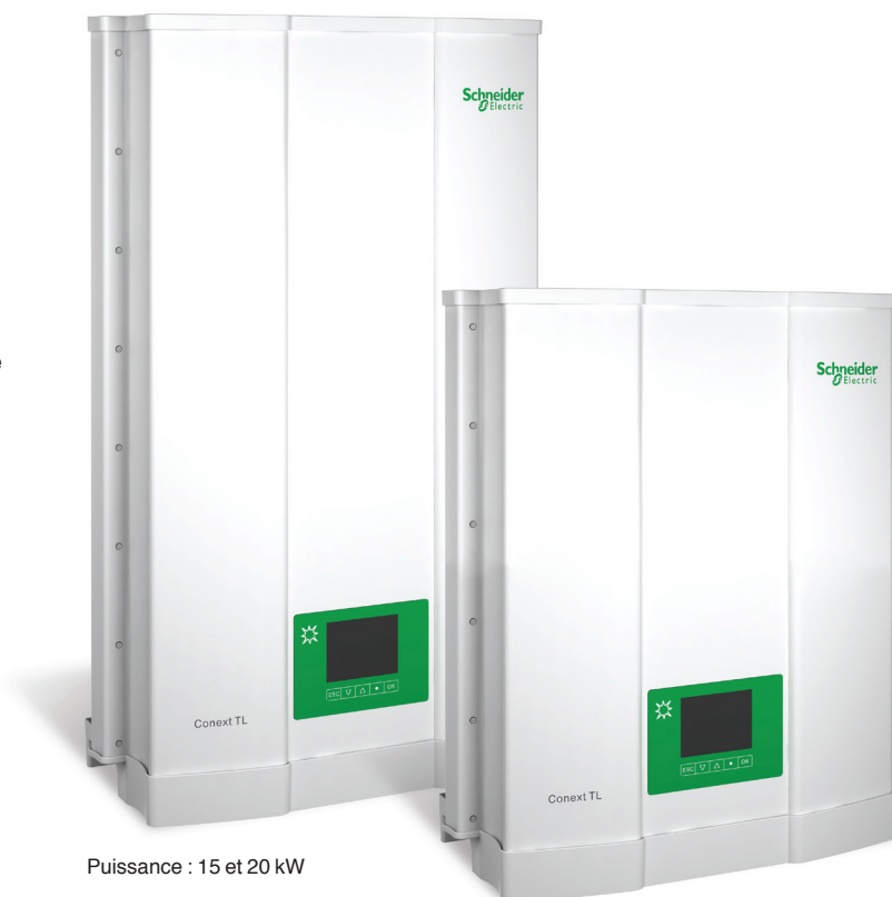
Puissance : 15 et 20 kW